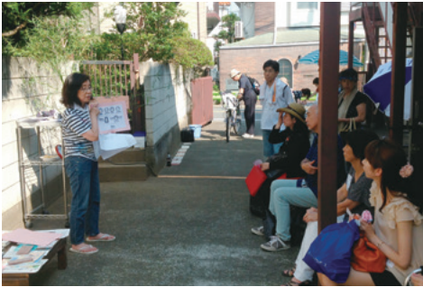
(写真2) 2013年7月に実施した「隣人祭り」

解のある看護師などの専門家が加わり、2014年には看護師、社会福祉士、理学療法士らが発起人となり準備会が設立され、