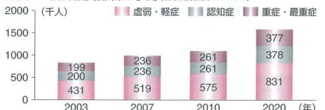
■図2 要介護高齢者の予測(保健福祉部、2003)

さらに、日本ですでに経験しているように、高齢人口の急激な増加は限られた資源をめぐる世代間の葛藤を引き起こしたり、経済成長を鈍化させたりするだけでなく、産業構造を変化させることが予想される。